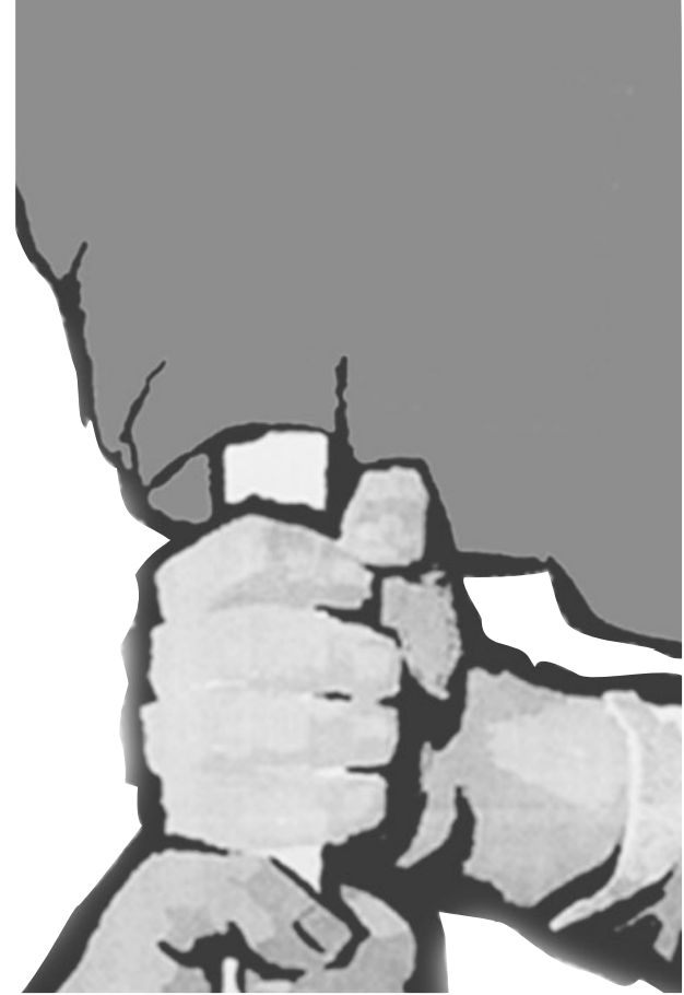
Günün çağırısı: Yıkalım bu köhne düzeni!

Burjuva siyasetinin seçimler yaklaştıkça koparacağı gürültü kirliliğine ve gerici propagandaya rağmen bu başarılabilir.